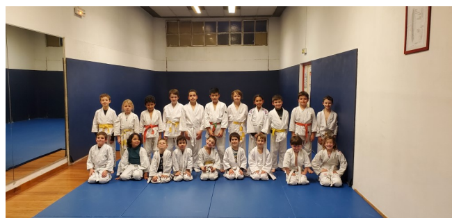
Photo Groupe 1 enfant Judo St Bau 2022