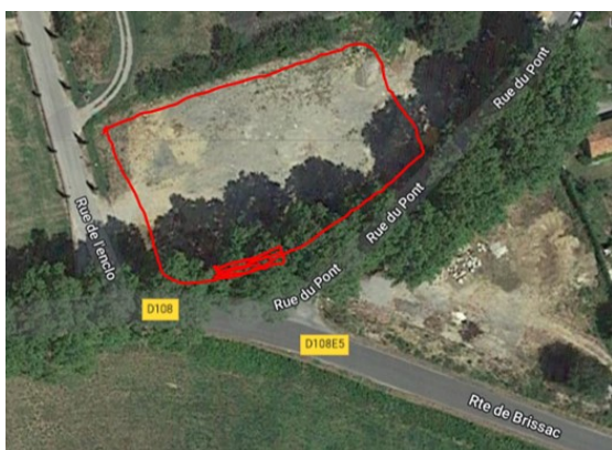
Parking « fond du village »

- Un portail coulissant va être installé sur l'espace situé entre le fond du village et le plan d'eau, au début de la rue du Pont (voir photo) pour réserver l'accès de ce parking aux habitants du bourg qui en feront la demande. Un badge leur sera remis (contre caution) permettant d'ouvrir le portail électrique. A terme, une caméra de surveillance sera installée sur ce parking. Le stationnement entre les platanes ne sera plus autorisé.